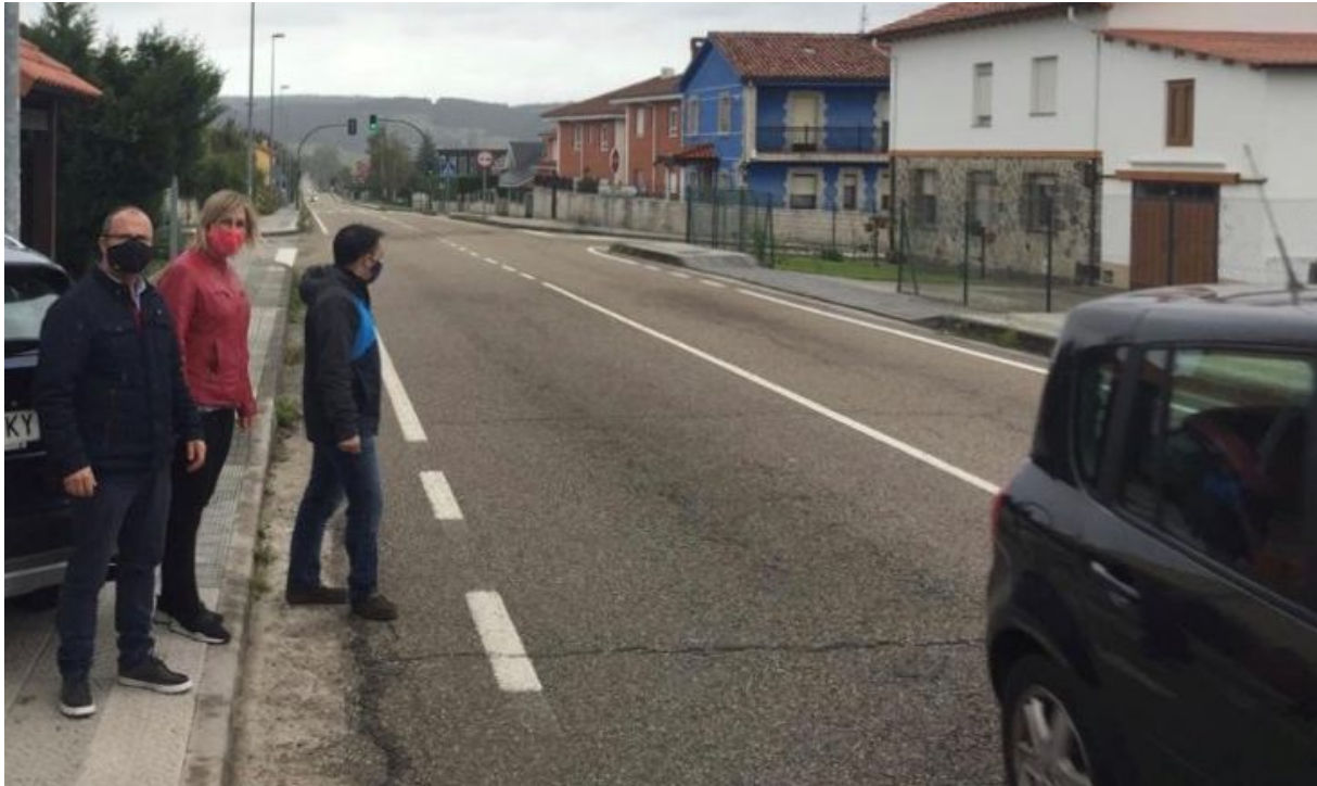
Cruce Barrio San Martín de Zurita con la CA-332 hacia Las Presillas

Además, hay zonas importantes y de mucha concurrencia como en la proximidad del apeadero de ADIF, a la altura del cruce en Barrio San Martín en Zurita que enlaza con la CA-332 hacia las Presillas.