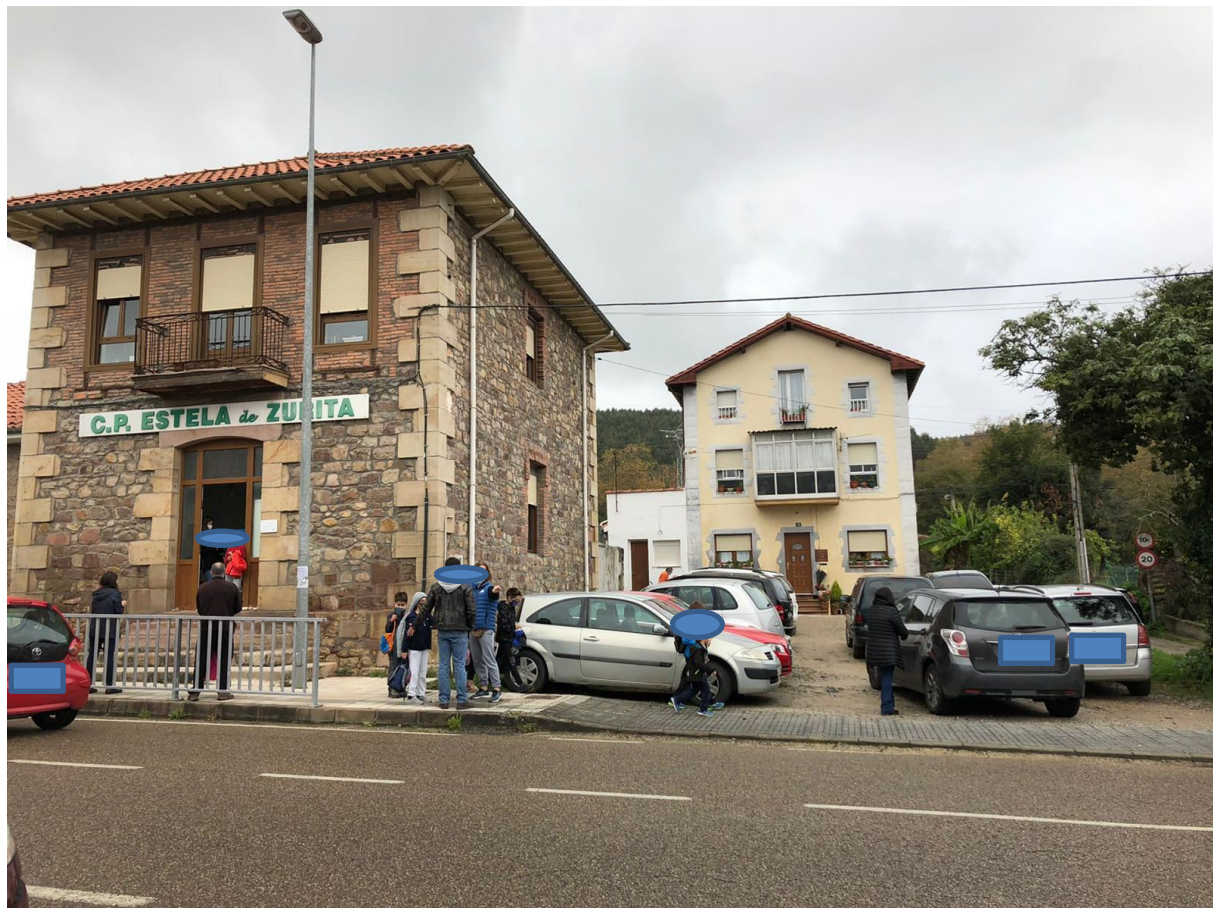
Afluencia de personas y vehículos a la salida del Colegio de Zurita

En esta zona hay un semáforo de pulsador, pero el verdadero peligro existente surge al conjugar la cantidad de turismos que circulan diariamente por esta vía, la velocidad en algunos casos, la constante entrada y salida de vehículos a los diferentes negocios, la afluencia de vecinos que acuden al Consultorio Médico y en especial los 80 niños y sus familias que acuden diariamente al colegio. Además, se añade la propia circulación que generan los vecinos que acceden a sus viviendas por las diferentes intersecciones que confluyen en esa misma zona.