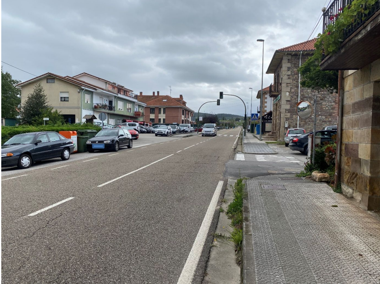
Varios vehículos en las inmediaciones de la CA-234 a la altura del Barrio el Bardal Zurita

Hay otra zona bastante peligrosa y concurrida que se encuentra en el Barrio Parayo, tanto en la intersección con la carretera municipal que comunica con el Barrio EL Arrabal, como en las entradas de la Urbanizaciones de Parayo o el Rubión con importante número de vecinos y zonas de recreo próximas a la carretera, como parque, pista deportiva, pista de tenis, piscina, etc.