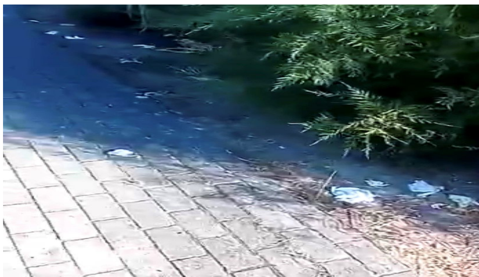
Entorno playa Somocuevas

Actualmente existe una preocupación bastante generalizada sobre la contaminación e impacto ambiental, además del riesgo que se está generando debido al desecho de las mascarillas de protección ante el Covid-19 después de su uso.