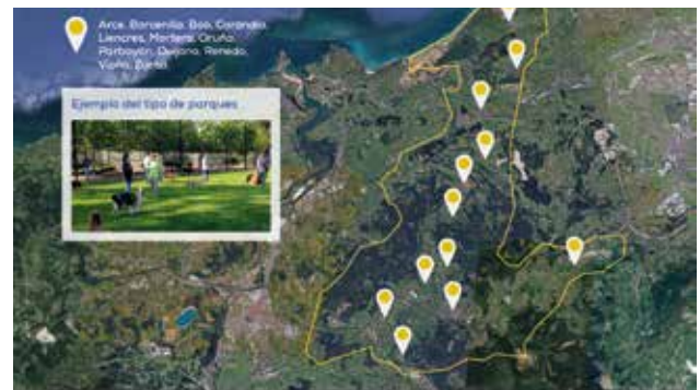
PIÉLAGOS | PARQUES CANINOS

33. Crearemos PARQUES CANINOS en diferentes pueblos del municipio, donde poder disfrutar con vuestras mascotas en un entorno adecuado y perimetrado. Así mismo, instalaremos expendedores de bolsas para recogida de excrementos en las ubicaciones con mayor demanda. Además, desarrollaremos la normativa necesaria para la implantación de un protocolo de autorización y gestión de las COLONIAS FELINAS por el MÉTODO CES .