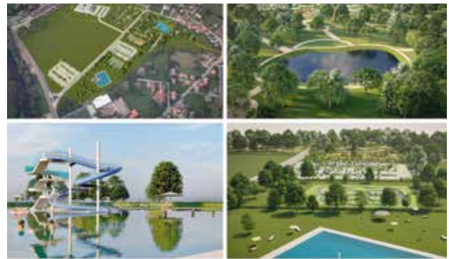
VIOÑO | PISCINA Y GRAN PARQUE CON PUMP TRACK

nes. Por un lado, proponemos la construcción de una MODERNA PISCINA DE VERANO . Por otro lado, queremos crear un GRAN PARQUE PÚBLICO NATURAL con mucha arboleda, donde se podrá disfrutar de tranquilos paseos y emocionantes circuitos entre los árboles. Imagina pasar un agradable día en familia disfrutando de la piscina y luego desafiando tus habilidades en los circuitos de aventura y PUMP TRACK en el mismo parque. Esta propuesta será un gran atractivo para todos los vecinos y visitantes de la zona que contarán con una gran campa abierta que pueda albergar grandes eventos. Además, intentaremos aprovechar la actual carretera de la antigua Cristalería incorporando un puente sobre el pequeño arroyo de Las Pasiegas para dotar de un nuevo vial que comunique los barrios Arrabal y San Lorenzo.