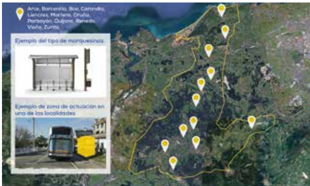
PIÉLAGOS | MARQUESINAS PARADAS ESCOLARES

9. Construiremos MARQUESINAS EN TODAS LAS PARADAS ESCOLARES y renovaremos todas las que sean necesarias. Tenemos muy presente vuestras demandas.