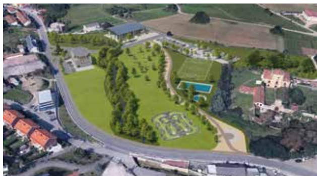
ARCE | NUEVAS INSTALACIONES TORRE DE VELO

50. Construcción de un conjunto de INSTALACIONES DEPORTIVAS y área de esparcimiento en la parcela TORRE DE VELO en Arce: CAMPO DE FÚTBOL 7, PUMP-TRACK y GIMNASIO CON PISCINA DE VERANO con zonas ajardinadas y senda en la ribera del arroyo. Este conjunto de instalaciones deportivas proporcionará un espacio completo para la práctica de diferentes deportes y actividades físicas, fomentando así un estilo de vida saludable y activo.