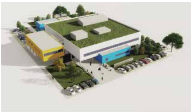
PIÉLAGOS CENTRO Y NORTE | CENTRO DE SALUD

10. Impulsaremos decididamente, en la zona centro-norte del municipio, un NUEVO CENTRO DE SALUD con servicio de urgencias SUAP y diferentes especialidades como pediatría, orientación, etc.