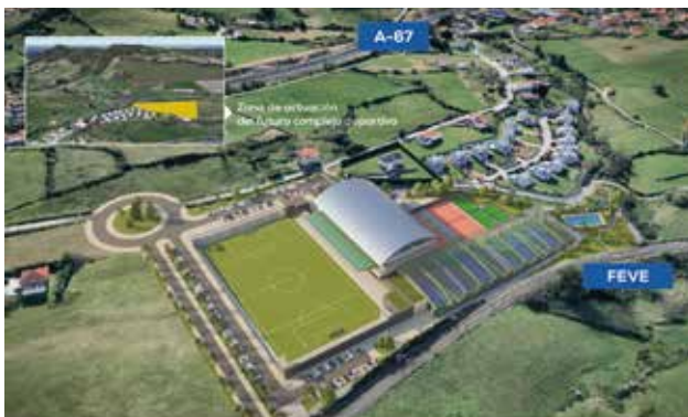
BOO | NUEVO COMPLEJO DEPORTIVO - SOCIAL

46. Promocionaremos la construcción de un MODERNO CENTRO DEPORTIVO-SOCIAL Y DE OCIO EN BOO , con piscina cubierta y al aire libre, gimnasio, campo de fútbol, pistas de tenis y pádel, ludoteca y mucho más para que deporte y conciliación laboral/familiar estén a vuestra disposición.