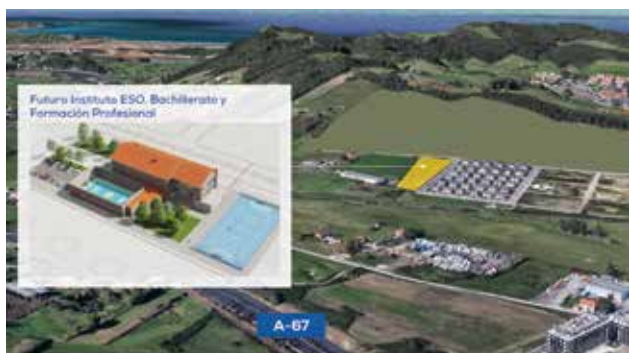
BOO | NUEVO INSTITUTO

1. Trabajaremos, desde el primer día, para convencer al Gobierno de Cantabria, de la necesidad de disponer de un INSTITUTO de Educación Secundaria, Bachillerato y Formación Profesional en Boo, que dé servicio a las localidades de la zona Norte. Se trata de un proyecto complejo de desarrollar, pero estamos convencidos de que es posible.