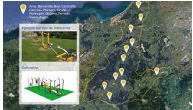
PIÉLAGOS | EJERCICIO FÍSICO AL AIRE LIBRE

14. Fomentaremos el EJERCICIO FÍSICO AL AIRE LIBRE , como mejora de la calidad de vida, implantando aparatos de gimnasia biosaludable y de calistenia en diferentes ubicaciones del municipio. Organizaremos talleres para dar a conocer sus beneficios y potenciar su uso.