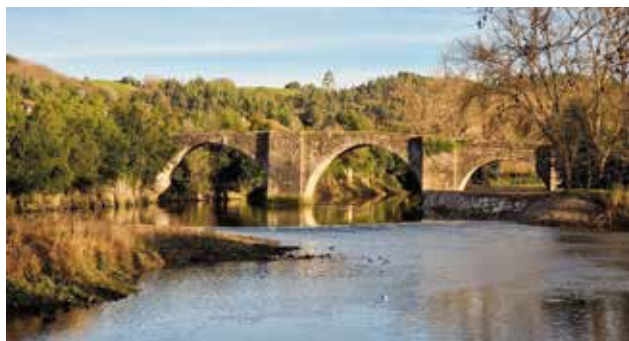
ARCE -ORUÑA | REHABILITACIÓN DEL PUENTE DEL SIGLO XVI

69. En defensa de nuestro patrimonio, nos comprometemos a exigir al Gobierno Regional la REHABILITACIÓN del emblemático PUENTE DEL SIGLO XVI que conecta Oruña con Arce. Este importante patrimonio merece ser protegido y puesto en valor. Trabajaremos para que se destinen los recursos necesarios para su recuperación.