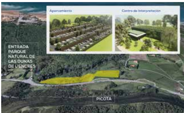
LIENCRES | CENTRO INTERPRETACIÓN Y APARCAMIENTO

93. Promoveremos la mejora integral del PARQUE NATURAL DE LAS DUNAS DE LIENCRES Y COSTA QUEBRADA . Crearemos un Centro de Interpretación Medioambiental que se convertirá en el eje central del parque. A su lado, desarrollaremos un parking disuasorio, priorizando siempre aspectos de sostenibilidad e integración medioambiental. Como medidas complementarias, mejoraremos los ACCESOS y los SERVICIOS PÚBLICOS de las PLAYAS DE LIENCRES , instalando papeleras, fuentes, duchas y aseos para garantizar la comodidad de los visitantes y preservar la limpieza y el medio ambiente. Asimismo, desarrollaremos un plan de mantenimiento constante para asegurar que estén siempre en óptimas condiciones, mejorando el disfrute de nuestras playas.