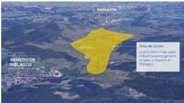
PARBAYÓN | POLÍGONO INDUSTRIAL 'LA PASIEGA'

59. Trabajaremos con el Gobierno de Cantabria para que por fin el POLÍGONO INDUSTRIAL DE LA PASIEGA sea una realidad y no un anuncio como lo lleva siendo desde el año 2006. Consideramos que esta actuación es fundamental para el desarrollo económico y social de Piélagos y Cantabria.