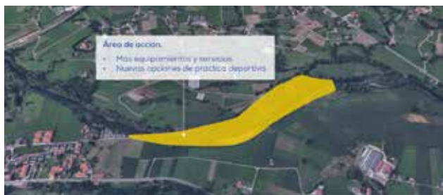
ZURITA | PARQUE 'EL PICÓN'

52. Conocedores de la gran afluencia y del encanto del PARQUE DEL PICÓN , le dotaremos de MÁS SERVICIOS Y EQUIPAMIENTO . Ampliaremos las opciones de práctica deportiva y mejoraremos el entorno del parque.