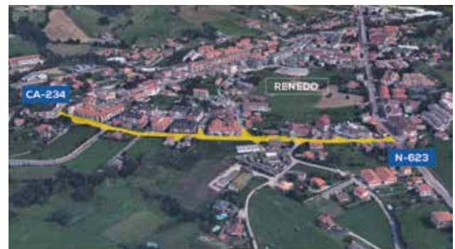
RENEADO | SEGURIDAD VIAL ZONA LLOSACAMPO

34. Solucionaremos definitivamente el problema de SEGURIDAD VIAL en la zona de LLOSACAMPO , en Renedo (desde la Picota hasta la CA-234).