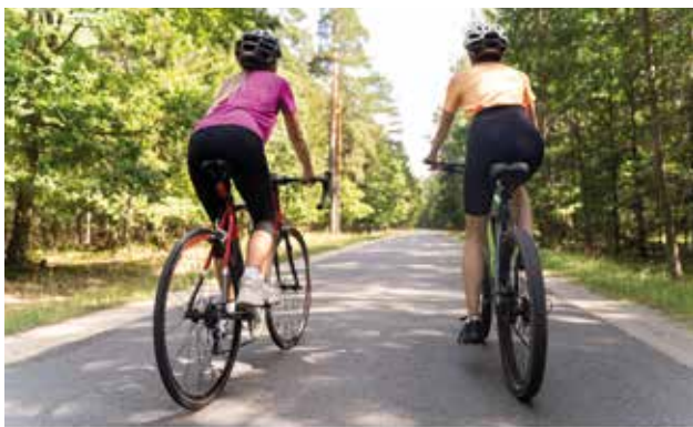
PIÉLAGOS | SENDAS PEATONALES Y CICLABLES

77. Desarrollaremos un ambicioso PROYECTO MUNICIPAL DE SENDAS PEATONALES Y CICLABLES SEGUROS , que conecte TODOS LOS PUEBLOS y el PARQUE NATURAL , permitiendo a nuestros vecinos desplazarse de manera sostenible y recuperando zonas degradadas a su paso. Para ello, llevaremos a cabo un ESTUDIO DETALLADO de las necesidades y posibilidades del municipio en cuanto a movilidad sostenible, contando con la PARTICIPACIÓN DE LOS VECINOS Y COLECTIVOS IMPLICADOS . Este estudio nos permitirá definir las rutas más adecuadas, primando aspectos como la seguridad, la accesibilidad y la conexión con los puntos de interés del municipio. Trabajaremos para buscar las fuentes de financiación necesarias para llevar a cabo este gran proyecto y conseguir avanzar hacia un municipio más verde, sostenible, saludable y accesible para todos.