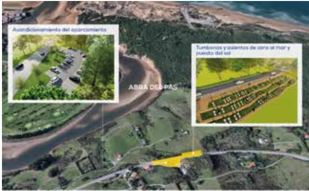
LIENCRES | MIRADOR DEL ABRA DEL PAS

92. Promoveremos la creación de un centro de interpretación de la ribera del Pas y sus gentes, en el entorno del MUELLE DE ORUÑA , que impulse el turismo de la zona. Se complementará con la dotación de más equipamientos infantiles. Además, estableceremos un itinerario seguro para el peatón que comunique el entorno del Puente Viejo y el Muelle.