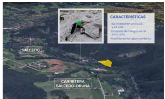
SALCEDO | ESCUELA DE ESCALADA EN ROCA NATURAL

48. Podrás desafiar tus habilidades en el nuevo ROCÓDROMO que vamos a construir en VIOÑO . La pared del frontón se convertirá en un nuevo terreno de juego, con una sección horizontal perfecta para poner a prueba tus destrezas. Además, habilitaremos otro ROCÓDROMO , al aire libre, en la ANTIGUA CANTERA DE VIOÑO (carretera Salcedo–Oruña).