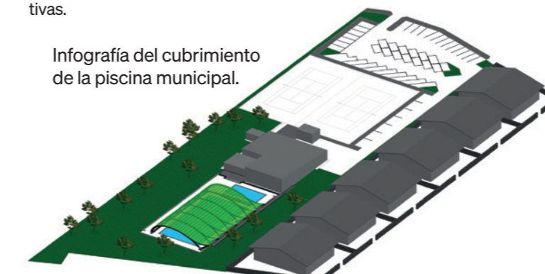
Infografía del cubrimiento de la piscina municipal.